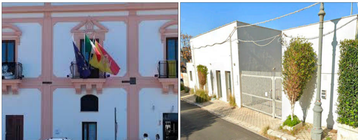
Fig. 1 - Sede principale e secondaria del Centro Operativo Comunale di Protezione Civile (indicata dalla A.C.)