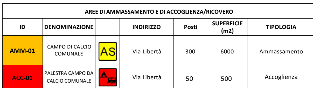
Tab. 15 - Aree e strutture di ammassamento-accoglienza della popolazione

In ogni caso per questi edifici, siano essi pubblici o privati, la loro integrità dovrebbe essere comprovata da una verifica tecnica rispetto al rischio sismico, idrogeologico e da incidente rilevante. A tale proposito si rileva che tutte le strutture di accoglienza previste non sono soggette al rischio idrogeologico né di maremoto/tsunami.